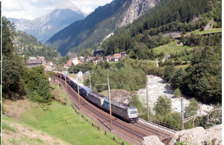
Güterzug auf der unteren Meienreussbrücke bei Wassen. 06. September 2006.

Zwei BLS Railpool Loks BR 187+152 ziehen einen Containerzug bei Gurtnellen Richtung Süden. 12. September 2016.