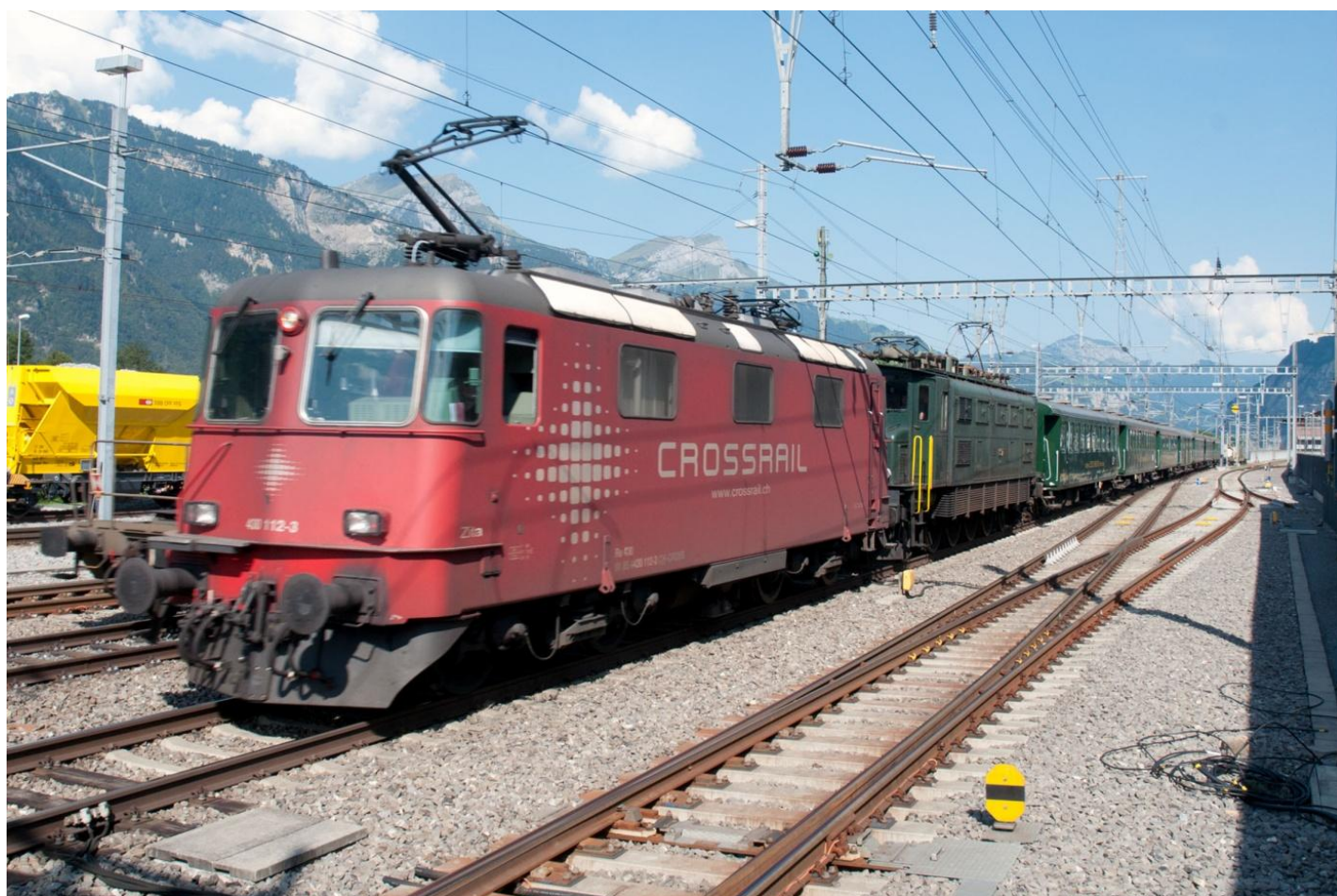
Die Vorspannlok Re 430 112-3 verdeckt bei der Durchfahrt in Altdorf Bf. die Sonderzuglok Ae 4/7 10997

Seit Sonntag den 11. Dezember 2016 rollt der Personenverkehr durch den 57. km langen Gotthard-Basistunnel. Der Güterverkehr wurde schon teilweise ab September durch die zwei Röhren geleitet. Also war dieses Jahr die letzte Gelegenheit den Zugverkehr auf der Bergstrecke im Foto nochmals festzuhalten. Im September unternahmen wir eine mehrtägige Tour mit Quartier in Wassen und Biasca. Unser Ziel war lange Güterzüge sowie am Sonntag den 11. September 2016 Sonderzüge abzulichten, denn die Zukunft der Bergstrecke ist ungewiss. Ab Inbetriebnahme des Basistunnels verkehrt nur noch stündlich ein Regionalexpress über die Bergstrecke, der Fern und Güterverkehr wird ausschließlich durch den Tunnel geleitet. Ein weiteres Kapitel Bahnkultur ist somit Geschichte und kann nur noch im Bild und Film wiedergegeben werden. Die Gotthardbergstrecke war auch beliebt bei Sonderfahrten mit historischem Rollmaterial, Dutzende Bahnfotografen verfolgten die Nostalgiezüge um sie an den markanten Punkten abzulichten. Auch dies wird in Zukunft nur eingeschränkt möglich sein. Siehe nachfolgendes Bild:.