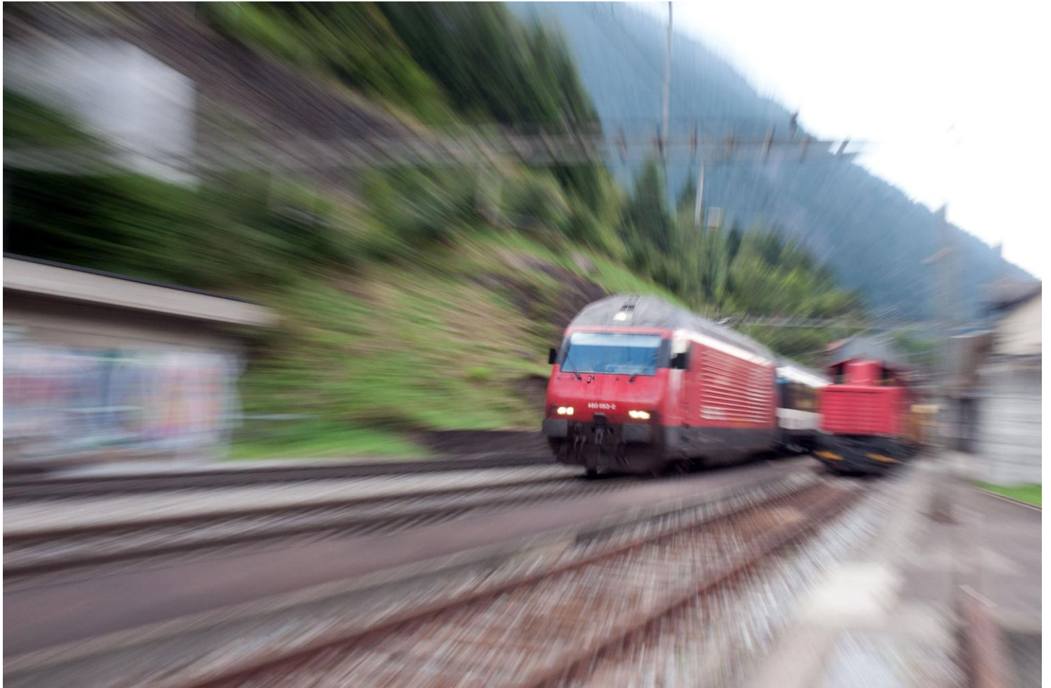
Re 460 055-2 fährt mit einem Intercity ohne Halt durch den Bahnhof Wassen.

Am letzten Aprilwochenende 2017 findet im Stockheimer Modellbahnhof das nun schon zehnte Bahnhofsfest statt. Dort werde ich mit meiner Fotogruppe eine neue Fotoausstellung zeigen, mit dem Thema "Abschied von der Gotthard Bergstrecke" Auf ca. 30 Tafeln mit je 3 Bildern 20x30 cm und Texterklärungen werden wir an diese großartige Bahnstrecke erinnern.